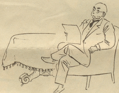
Unsere Väter in ihrer freien Zeit