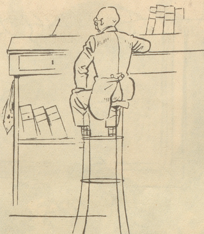
Unsere Väter im Büro