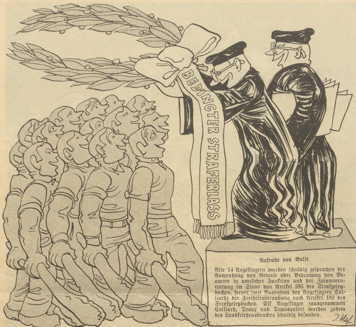
Aufrubr von Bülle

Alle 14 Angeklagten wurden schuldig gesprochen der Anwendung von Gewalt oder Bedrohung von Beamten in amtlicher Funktion und der Zusammenrottung im Sinne von Artikel 285 des Strafgesetzbuches, ferner (mit Ausnahme des Angeklagten Colliard) der Freiheitsberaubung nach Artikel 182 des Strafgesetzbuches. Elf Angeklagte (ausgenommen Colliard, Droux und Dupasquier) wurden zudem des Landfriedensbruches schuldig befunden.