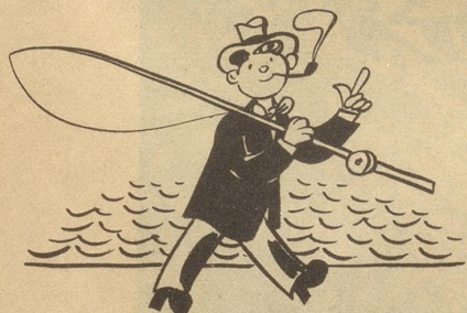
„Vielleicht wird das Glück anbeißen!“ sagt er sich und geht ein Los kaufen ...