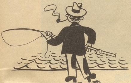
Nach 6 Stunden wird ihm klar, daß die Fische nicht wollen.