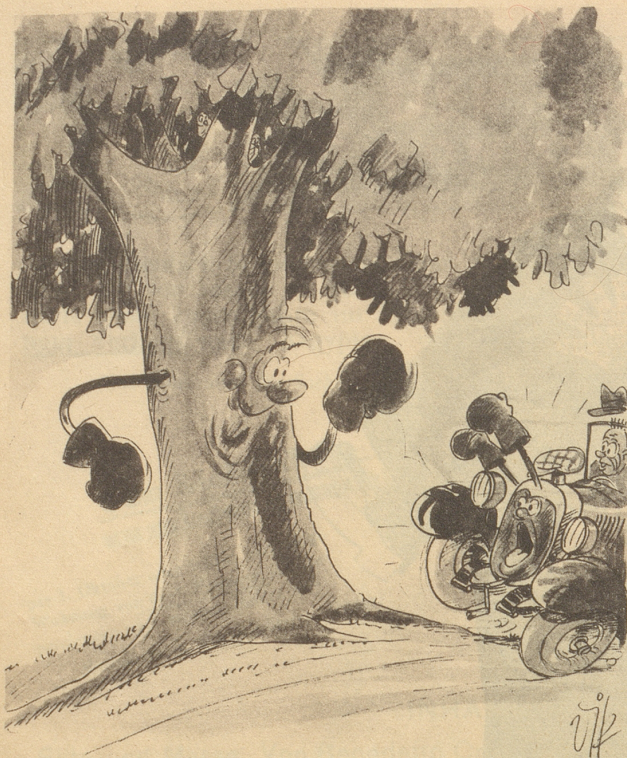
Es wird wieder trainiert!