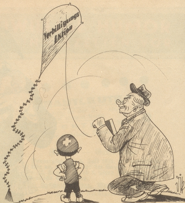
Das ist die schöne Zeit der Drachen, Die Väter ihren Kindern machen!