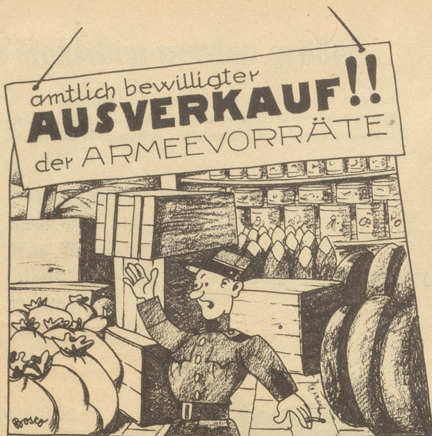
Eine sympathische Liquidation!