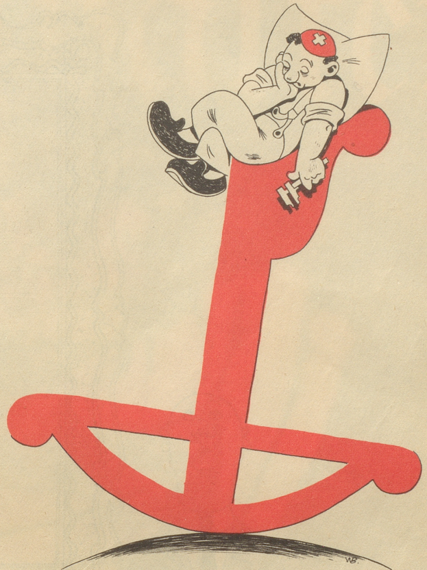
Unsere Industrie muß noch leistungsfähiger werden, Qualität allein genügt nicht mehr!