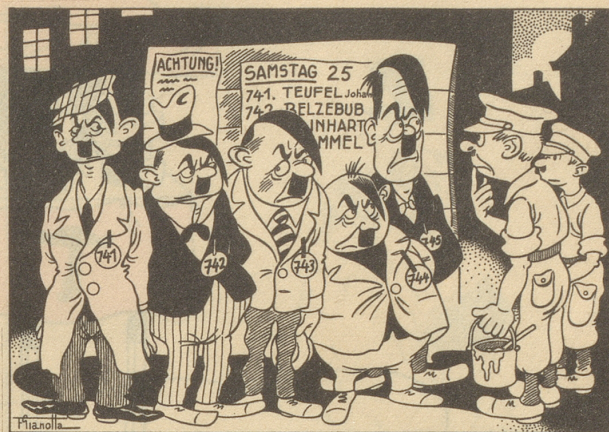
Immer noch alliierte Suche nach Hitler!