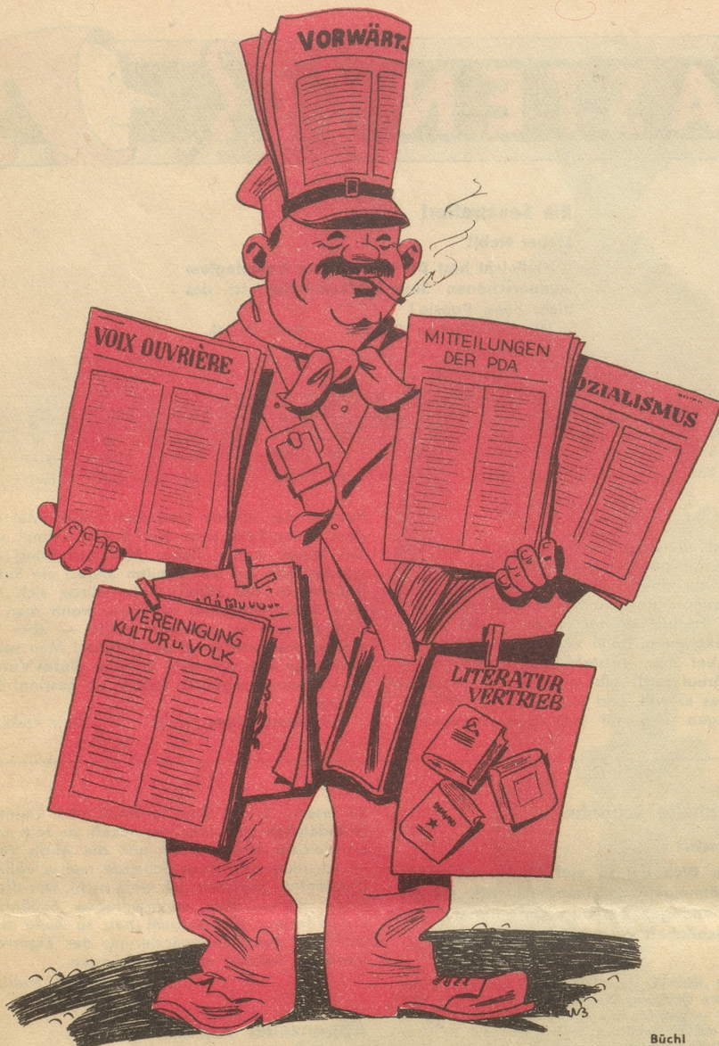
Die offiziellen und inoffiziellen Propagandaschriften der PDA.