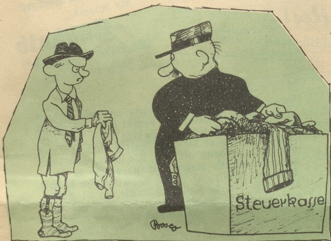
Nach dem Krieg zieht der Staat seine Bürger aus!