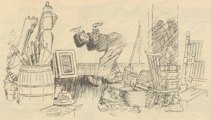
Wo und wenn ich mir denn 's Klavier abegschliff?