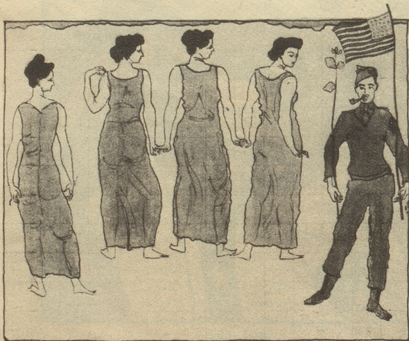
Jüngling, vom Weibe bewundert frei nach Hodler