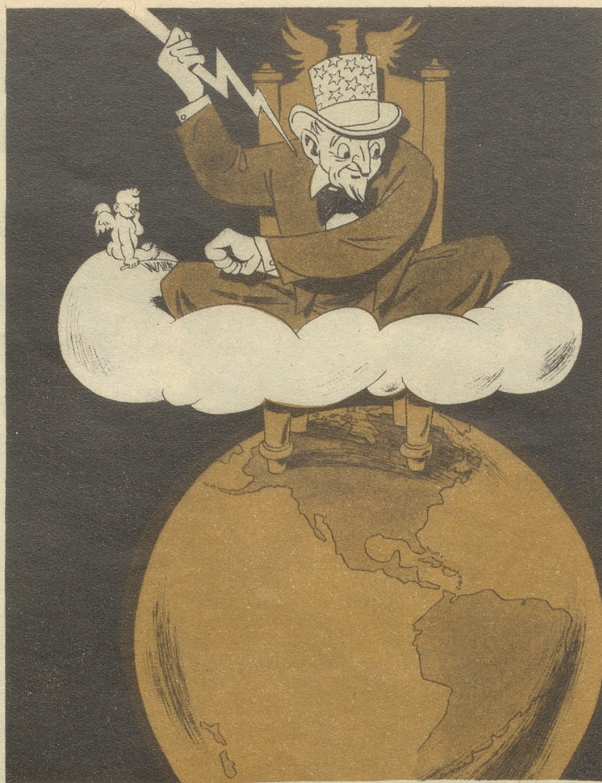
Zeus der Jüngere

Ich chönnt jetzt wänn i wett und wänn i nöd sälber druf sitze würd!