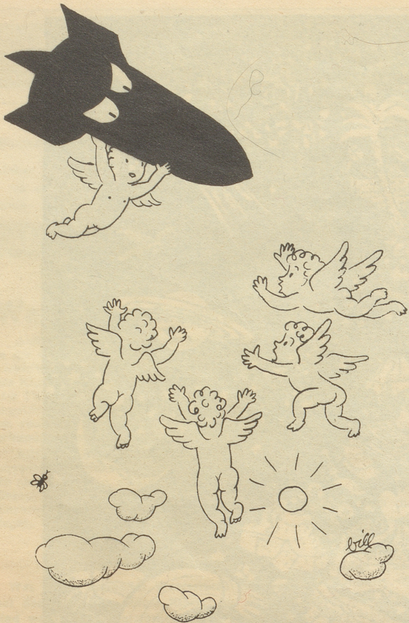
Die Atombombe wird solange dem Frieden dienen, als man sie nicht fallen läßt!