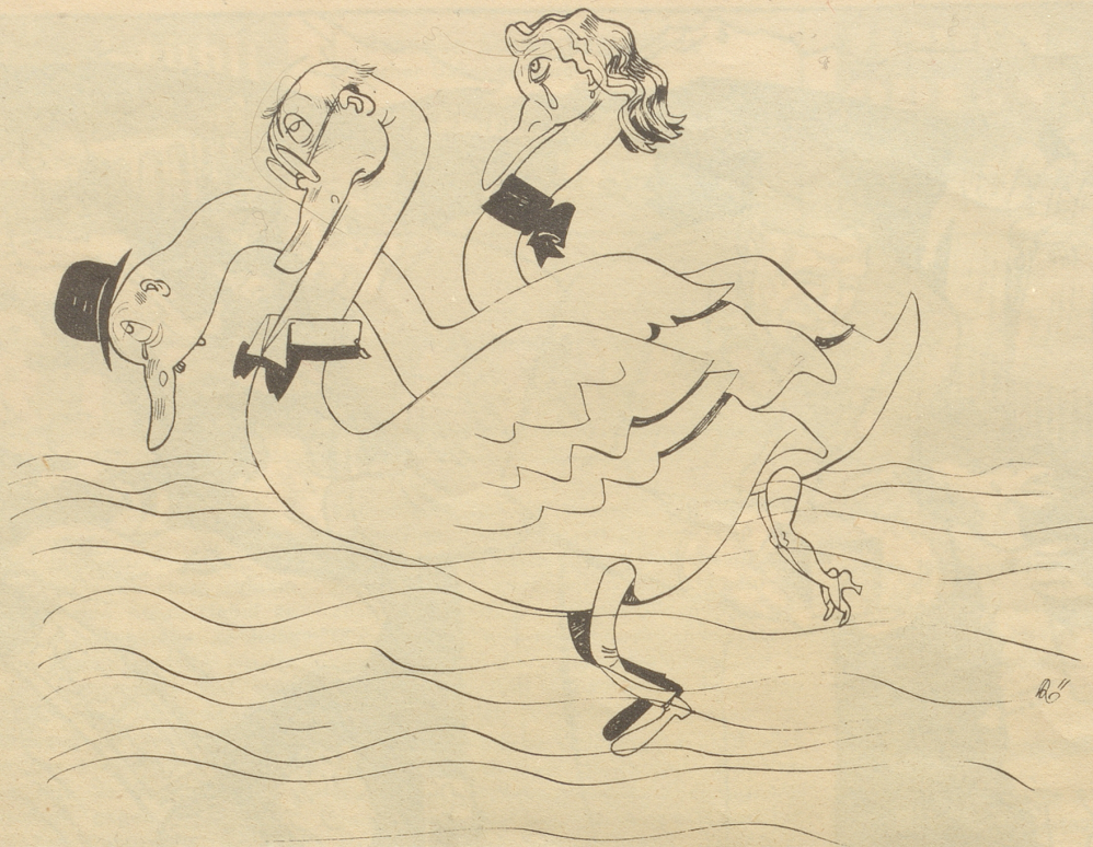
Pessimismus wieder große Mode

Lasset uns wieder warnen und mahnen, Lasset uns Schlimmes wittern und ahnen, Lasst uns in Chören und in Vereinen Um unsere Zukunft bitterlich weinen, Denn die Zukunft spottet jeder Beschreibung, Abgesehen von der Atomverheibung