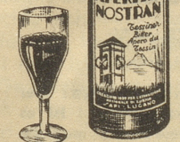
Tessiner Spezialität der Firma SAPI LUGANO