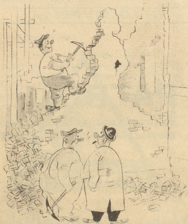
«Er wollte einmal Bildhauer werden!» Söndagsnisse-Strix

«Du, Mame, weles sind jetz die Hundertjährige?» F. G. M.