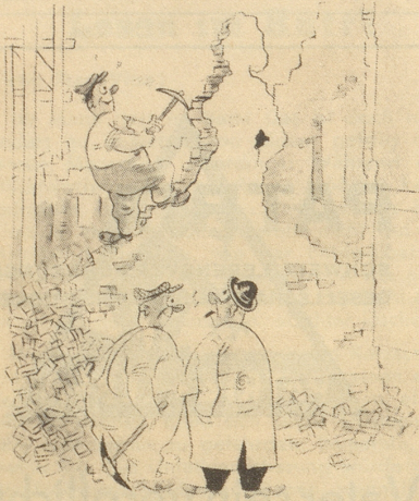
«Er wollte einmal Bildhauer werden!» Sondagsnisse-Strix

«Du, Mame, weles sind jetz die Hundertjährige?» F. G. M.