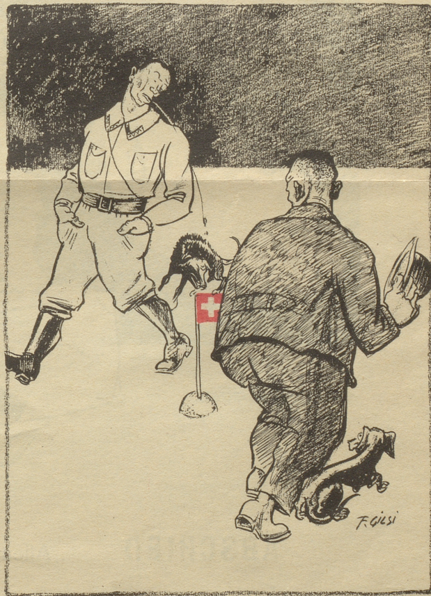
Nazi — einst und jetzt