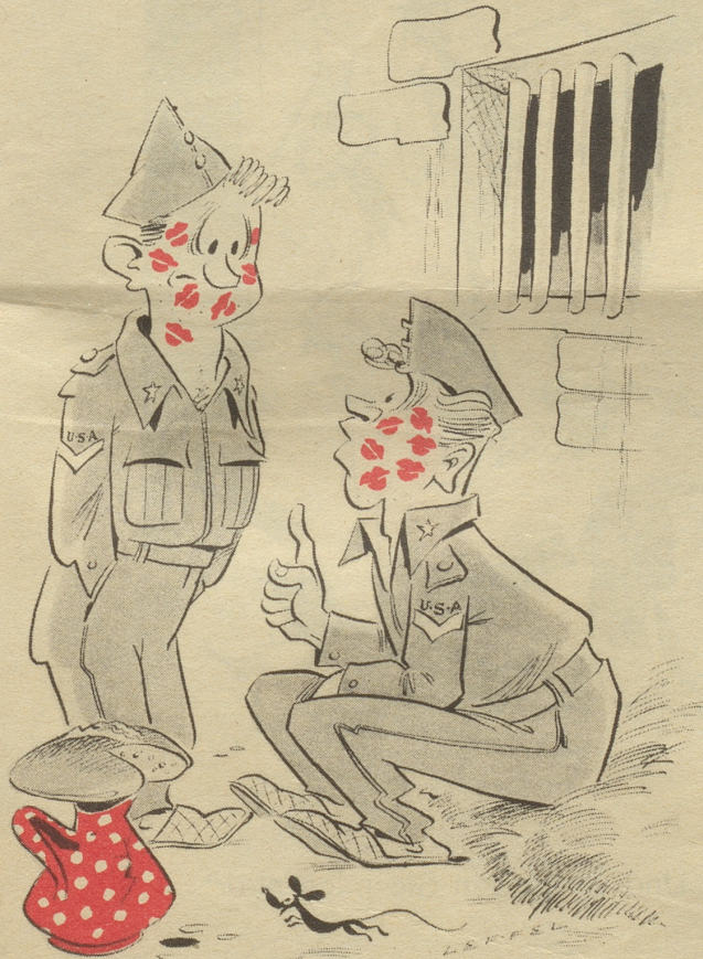
„Aha — Du hast auch zu heftig fraternisiert?!“