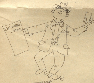
Denn dieser hat das grosse Los!