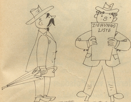
Ach hätt' er nur Herrn Meiers Los,