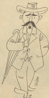
Herr Huber hat ein schweres Los.