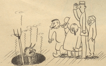
Auf der Suche nach Hitler

Pauschalarrangements pro Woche: Schweizerhof Fr. 121.- National Fr. 110.- Bellevue Fr. 102.- Restaurant National: Rendez-vous der Feinschmecker