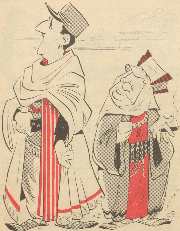
Es wird auch hier nicht fraternisiert!