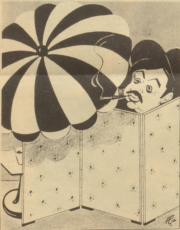
Die spanische Wand