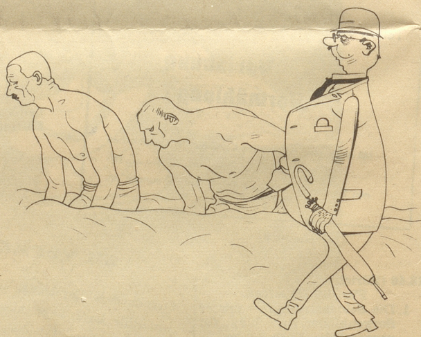
Der Gemeinderat von Gams hält sich auf über „das Arbeiten und Auftreten ohne Hemd auf öffentlichen Straßen und Plätzen“ und verwarnet die Fehlbaren allen Ernstes.