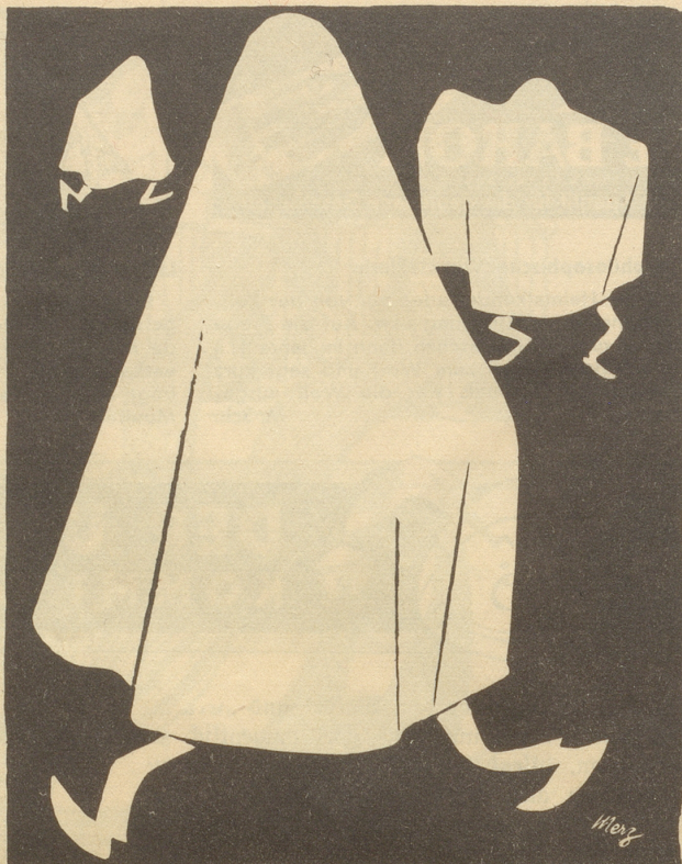
Im Verlauf der Useputzete Weißes Tuch sehr gefragt