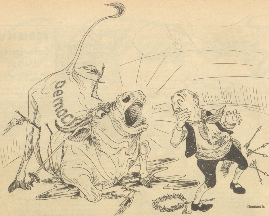
FRANCO: „Caramba, ich hatte ihn doch getötet!“