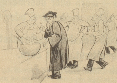
Der Englischprofessor überwacht die Zubereitung der Buchstaben-Suppe. Life

gefühl, auf diese stramme Art, wie wir HD eben grüßen, geehrt zu werden, leicht neidisch. Auch HD haben gute Gedanken und weitreichende Beziehungen. Es gelingt uns, einen Uniformrock mit den Gradabzeichen eines Obersten zu beschaffen. Der imposan-