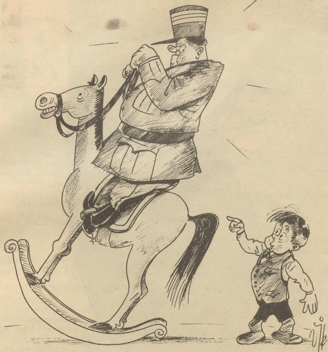
An die, die es angeht „Dir chöit etz wider abechoo!“