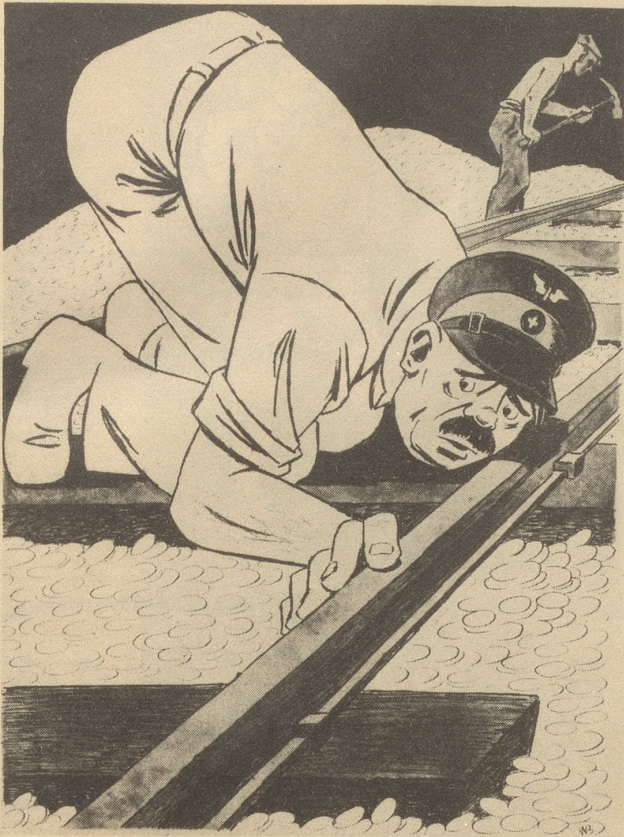
Neue Erhöhung der Bahntaxen in Sicht.

„s hät sich e chli gsänkt, me sött wieder e paar Garette voll underegrampe.“