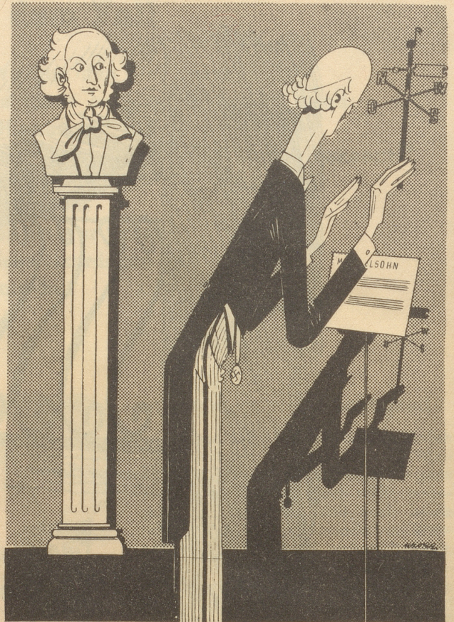
Furtwängler dirigierte in Berlin Werke von MENDELSSOHN ... mit seinem rühmlichst bekannten Taktstock!