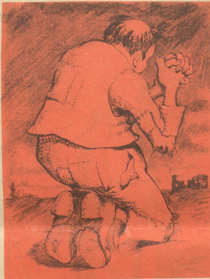
Das Friedensgebet des hl. Franz von Assisi

So tönte es im Frontenfrühling, aber die Hirtenknaben ließen sich nicht einschüchtern. Inzwischen aber hat das 20. Jahrhundert den Nationalsozialismus und den Faschismus in die Schranken gewiesen. EKZ.