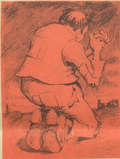
Das Friedensgebet des hl. Franz von Assisi

So tönte es im Frontenfrühling, aber die Hirtenknaben lie;en sich nicht einschüchtern. Inzwischen aber hat das 20. Jahrhundert den Nationalsozialismus und den Faschismus in die Schranken gewiesen. EKZ.