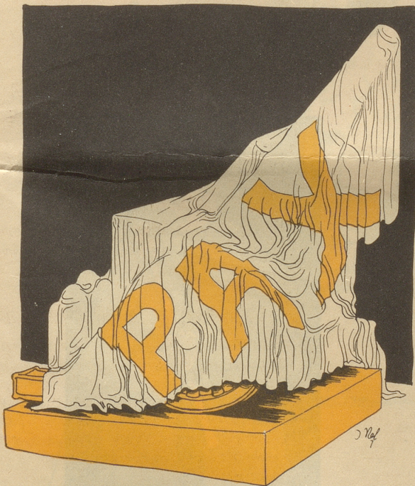
Der Friede von München!

«— also schließen wir mit ihm einen Nichtangriffspakt ab!»