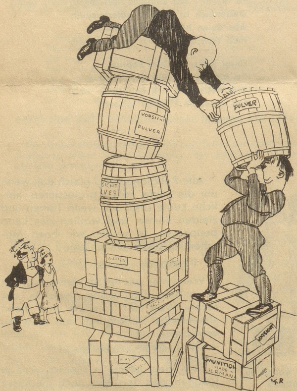
John Bull: Glaubst Du, Mariannchen, daß ein Pulverturm in den Himmel wächst!