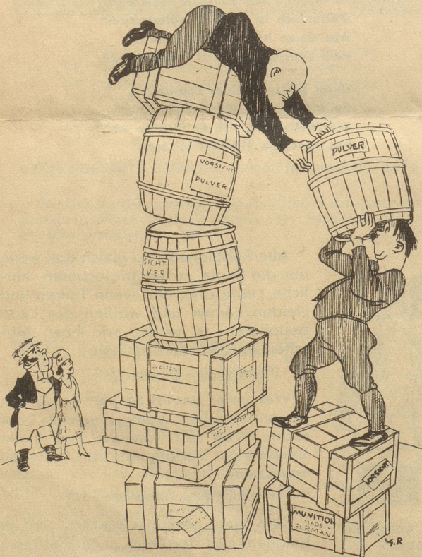
John Bull: Glaubst Du, Mariannchen, daß ein Pulverturm in den Himmel wächst!