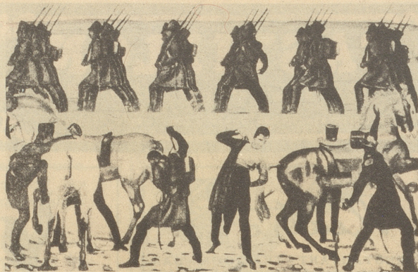
Hodlers Studenten, an einer Wand der Universität in Jena

Die deutsche Gesandtschaft hatte auf Befehl der deutschen Regierung wegen dieser Zeichnung bei Bundesrat Motta erfolglos protestiert.