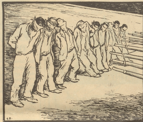
Tschechische Studenten, an einer Wand der Universität in Prag

Wegen dieser Zeichnung ist dem Nebelspalter die Vorzensur angedroht worden.