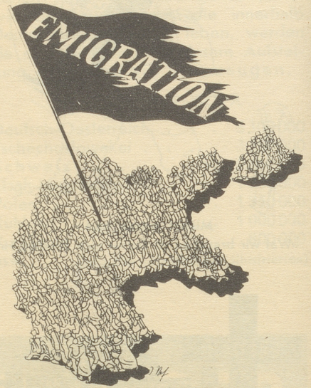
Das andere Deutschland