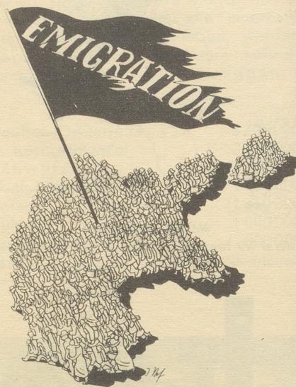
Das andere Deutschland