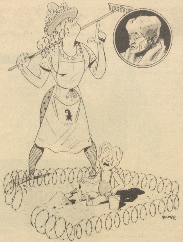
In Basel werden die schönen, öffentlichen Kinderspielflächen mit Stacheldraht umzäunt.

„Jäää wisse-Si, Sie guete Herr Erasmus, das isch halt quasi — Nietzsche-Humanismus!“