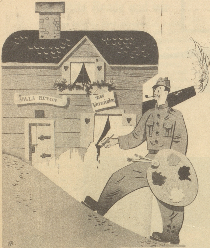
Der Tarnungskünstler von 1939-44 macht useme Bunker es Eifamiliehüsl