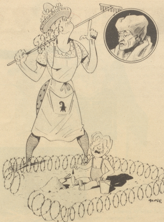
In Basel werden die schönen, öffentlichen Kinderspielflächen mit Stacheldraht umzäunt.

„Jäää wisse-Si, Sie guete Herr Erasmus, das isch halt quasi — Nietzsche-Humanismus!“