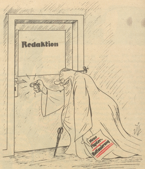
En wüeschte Bsuech!