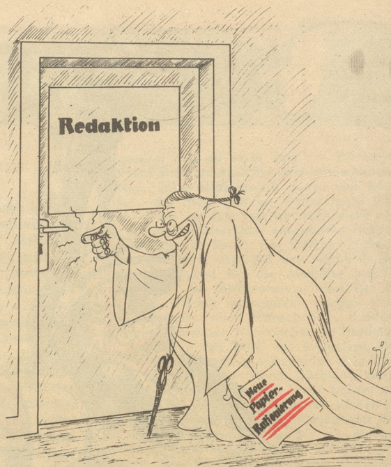
En wüeschte Bsuech!