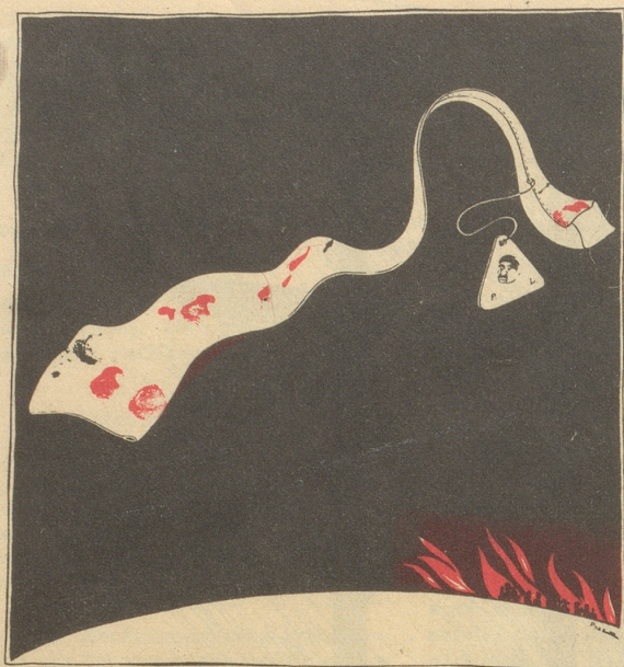
Lavals „weiße“ Krawatte wollte sich davonschlängeln