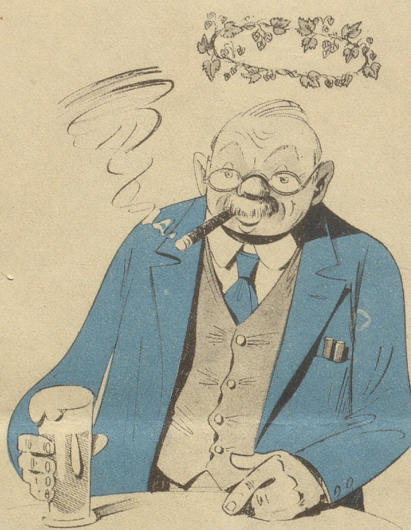
Der Bierlichstrategie hatte recht, wir wunden ihm den Hopfenkranz.

Willst Du eine Wahrheit wissen? Im „Central“ gibts stets Leckerbissen.