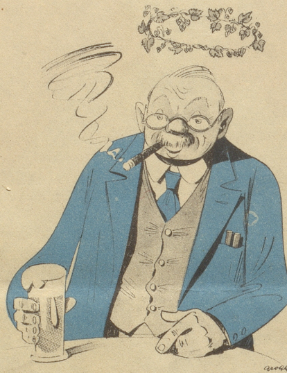
Der Bierlichstrategie hatte recht, wir wunden ihm den Hopfenkranz.

Willst Du eine Wahrheit wissen? Im „Central“ gibts stets Leckerbissen.