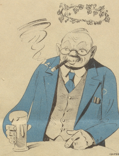
Der Bierlichstrategie hatte recht, wir wunden ihm den Hopfenkranz.

Willst Du eine Wahrheit wissen? Im „Central“ gibts stets Leckerbissen.