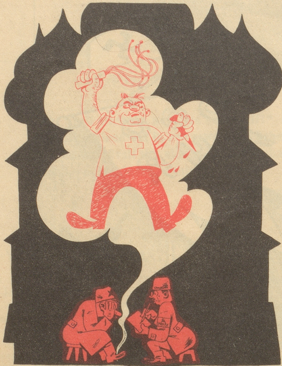
Der Orakler von Moskau diktiert einen Bericht über die Schweizer Gefangenenerlager