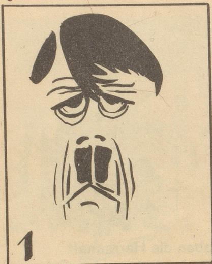
Gennosen onn Gennosinen!