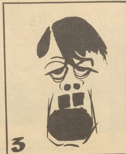
Firrzehn Jahrä lang hat er ihr das Mark ausgezogen!