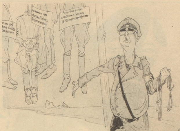
„Wir haben die Herrschaft in der Luft.“