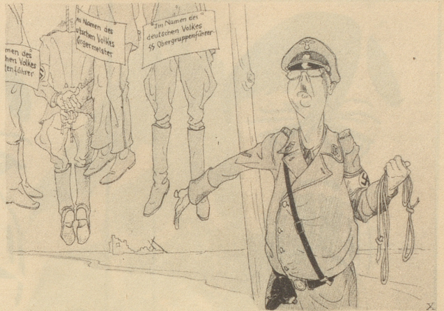
„Wir haben die Herrschaft in der Luft.“