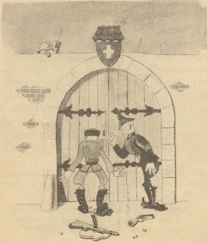
Da gits kes Herein!