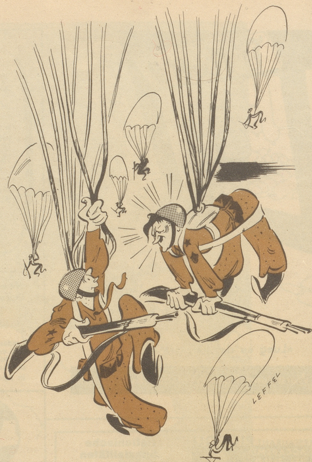
Abfahrt „Sagen Sie, Grenadier Krause, haben Sie vielleicht da unten Verwandte, bei denen Sie mich einführen könnten?“