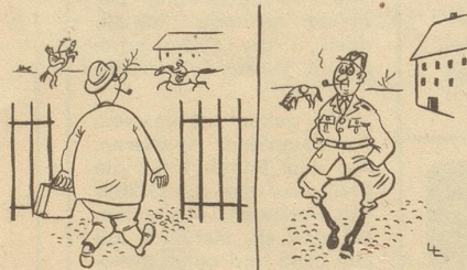
Drei Monate Kavallerie-Dienst Söndagsnisse Strix