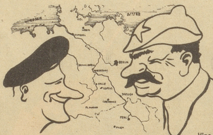
Frontverlauf Mitte April 1945!

Ein Wehrwolf ist ein Wolf, der sich in den eigenen Schwanz beißt! Kobold