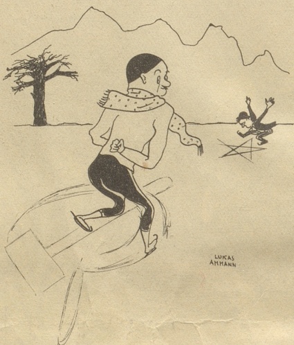
Figurenlaufen in der heurigen Schlittschuhsaison

Du bekämpfst Minderwertigkeitskomplexe am besten durch Lesen von Kri-