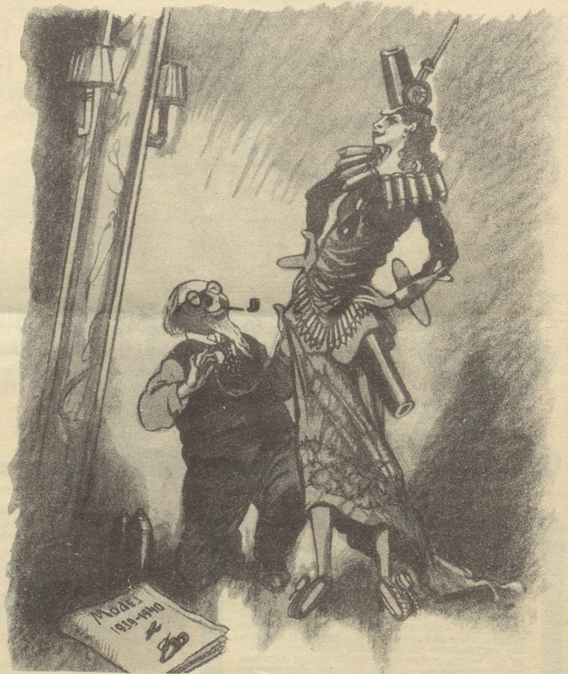
Рис. М. Храпковского