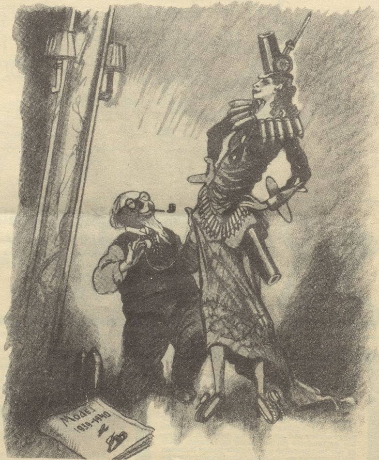
Рис. М. Храпковского