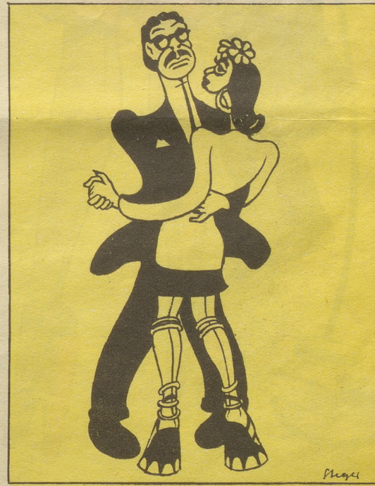
8 ... und hielt schließlich in den intellektuellen Kreisen Neandertals Einzug.