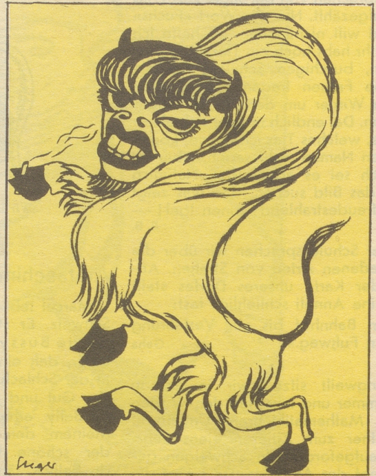
2 Viele Jahrtausende später lebte an den Gestaden eines helvetischen Sees das Büffelweib Dolly Buffalo-Bison. Ihr mondänes Wesen erregte Anstoß bei ihren Verwandten. Sie kehrte den kleinbürgerlichen Verhältnissen den Rücken und wurde Sängerin in einem Nachtlokal des wilden Westens.