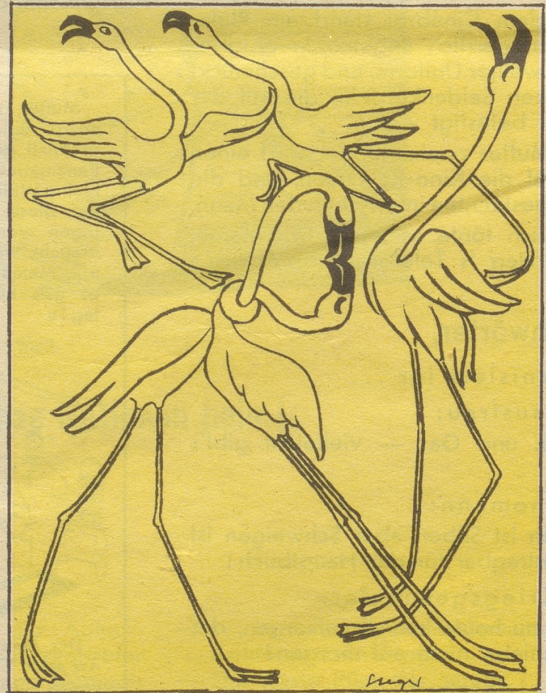
4 ... und daraus entwickelte sich schließlich der moderne Swing.