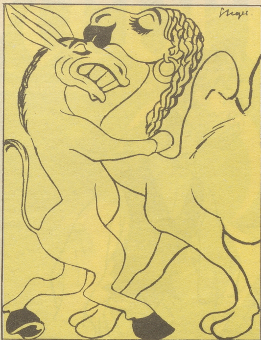
5 Der Swing kennt weder Klassen- noch Rassenunterschiede.