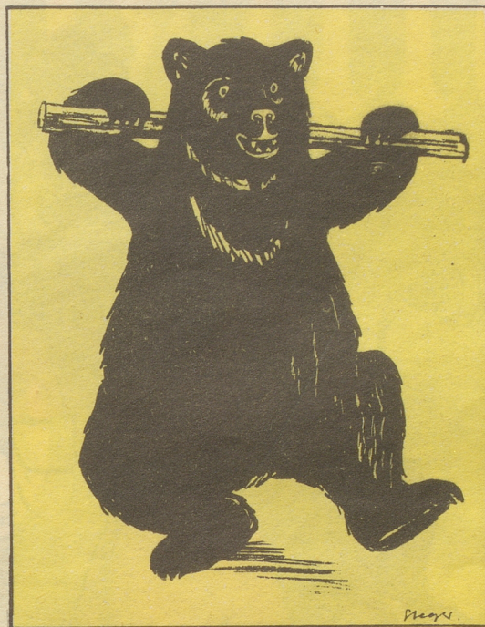
6 Einzig der Bär machte dieses Glöl nicht mit und tanzte weiter den Tanz seiner Urväter: den urchigen Ländler.